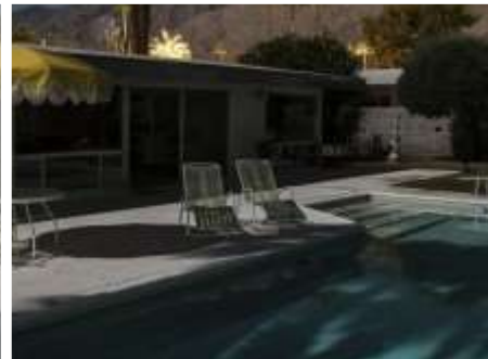
СРЕДНОЩНА МОДЕРНОСТ ОТ ТОМ BLACHFORD