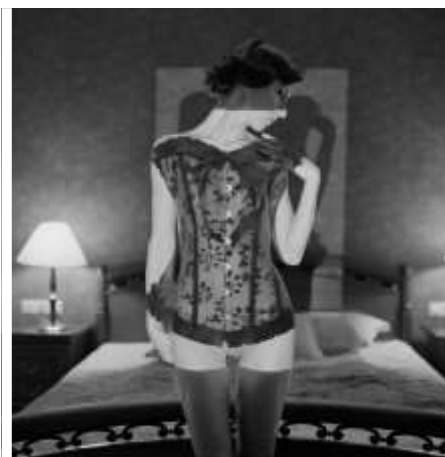
ФИЛОСОФИЯ В СПАЛНЯТА