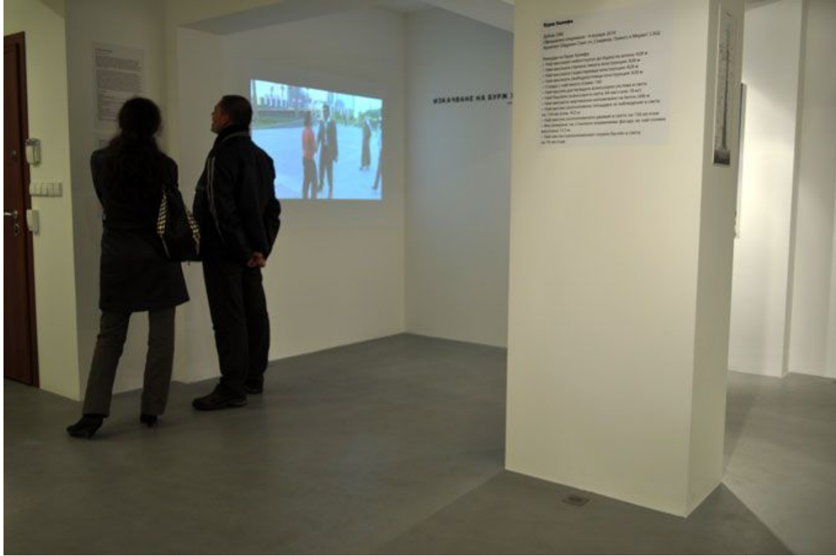
Изкачване на Бурж Халифа, 2010