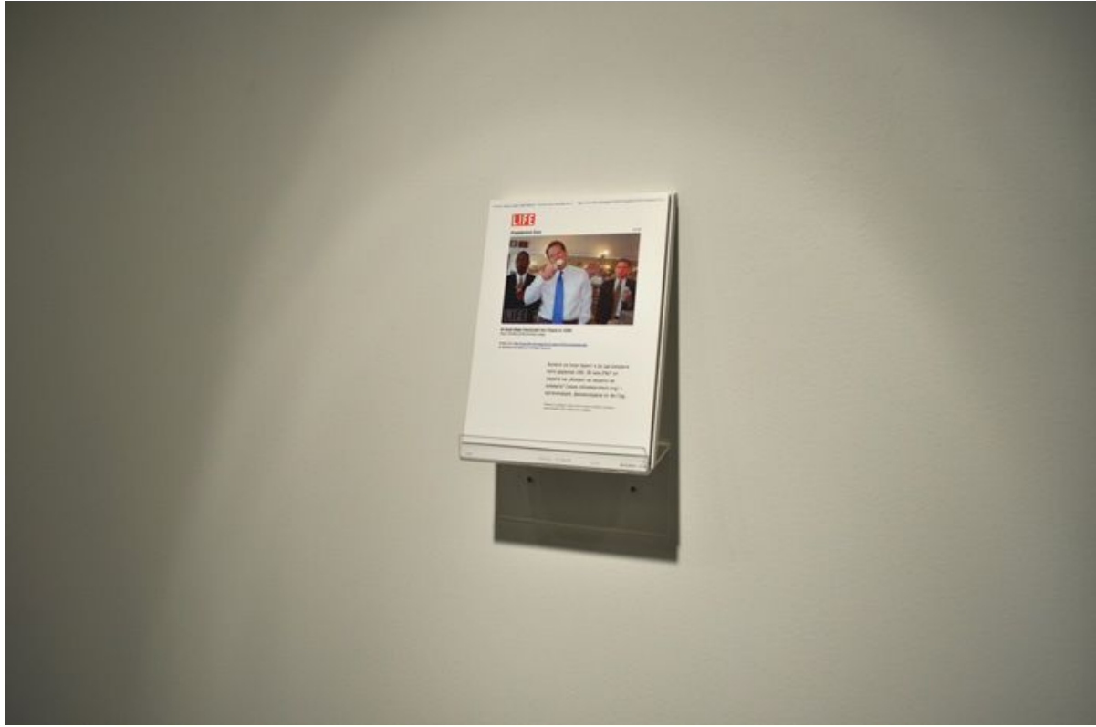
За повече лед!, 2010