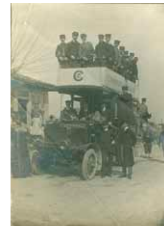
Първият автобус по линията Пловдив – Станимака (Асеновград), 1909 г.