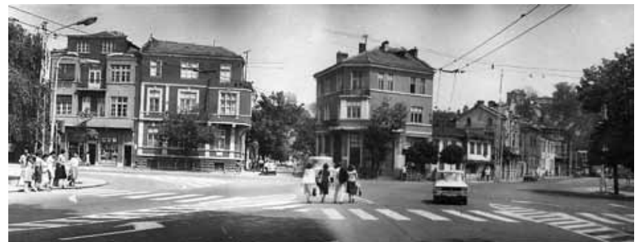
Сгради на ул. „Отец Паисий“, разрушени през 1983 г., поглед от пл. „Хан Крум“