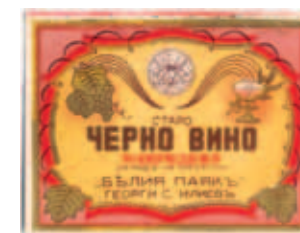
Етикет от пишещата на „Белия паяк“, 30-те години на XX век