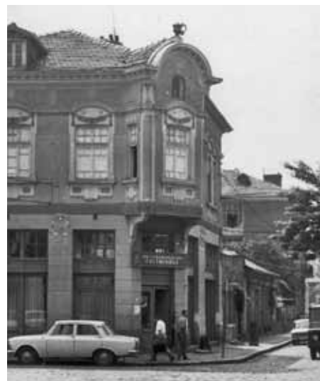
Вегетарианският ресторант, края на 70-те години на XX век

средата на 30-те), а от 1949 година до края на 80-те – Вегетарианският ресторант, евтино изхранил поколения пловдивчани.