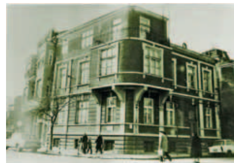
Сградата на ул. „Отец Паисий“ №44, разрушена през 1983 г.