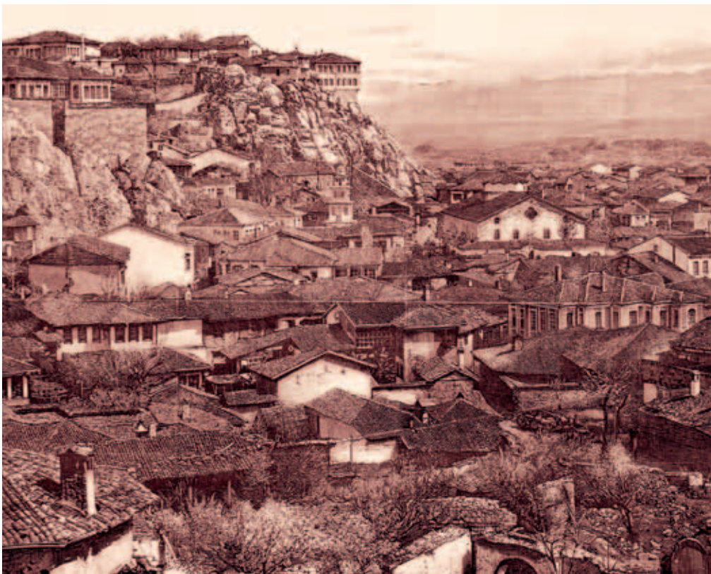
Пловдив във френска гравюра от 1882 г.