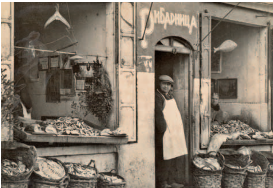
Рибарски магазин зад хотел „България“, 1931 г.