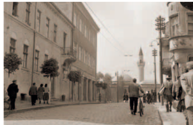
Улица „Отец Паисий“, 1960 г.