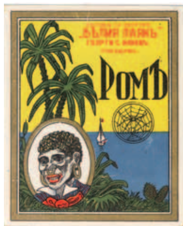
Етикет от пишещата на „Белия паяк“, 30-те години на XX век

През годините в нея са се помещавали бирарията „Прошеково пиво“ (към