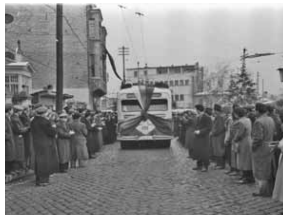
Тържество по повод пускането на първите тролейбуси в Пловдив, на 7 януари 1956 г.

Забързаният ритъм, извън традиционния спокоен начин на живот, свързва улицата и с развитието на градския и междуселищен транспорт. Още от началото на ХХ век на нея е била Станимашката пиаца – на площад „Станислав Доспевски“ (до сегашната Градска художествена галерия). Първоначално от нея по „Отец Паисий“ са тръгвали файтоните, а по-късно автобусите за Станимака (Асеновград). Първият автобус е от 1909 година. Пак на същото място се е намирала автобусната агенция „Родопи“. В годините на ранния социализъм (между 1956 и началото на 60-те) по улицата е минавал тролей и е построена тролейбусна подстанция. Тролеят върви само няколко години, но по-дълъг живот има автобус № 4, който излиза от кръстовището на площад „Хан Крум“ и отива към кръстовището на Джумаята (по Главната също е минавал автобус).