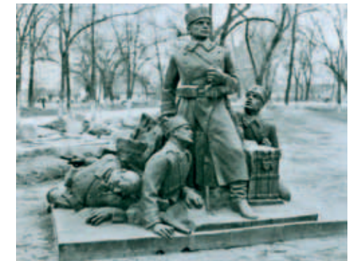
Паметникът на Гюро Михайлов на пл. „Хан Крум“ демонтиран през 1960 г.

намична, жива структура, свързана с манталитета и нуждите на градския човек от XX век. За разлика от Главната, с която се оформят по едно и също време и където се намират най-представителните ресторанти, хотели и магазини, „Отец Паисий“ е „задната страна“ на лустрото, където се подготвя, поръчва и поправя луксът – от модната шапка до автомобила.