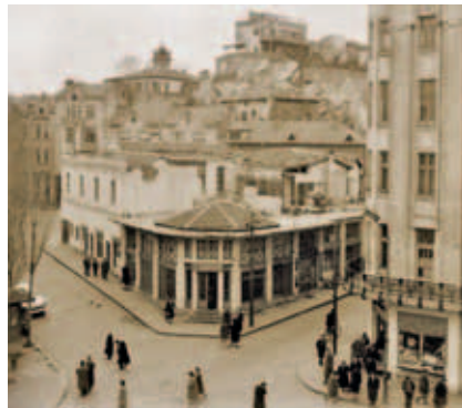
Началото на ул. „Отец Паисий“, 1960 г. (сега градинка на Джумая Джамия)