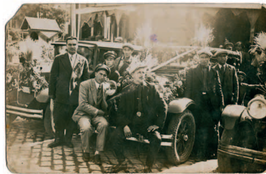
Празникът на шофьорите в Пловдив, 1930 г.