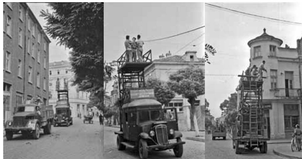
Поставяне на контактната мрежа за тролейбусите по ул. „Отец Паисий“ през 1955 г.