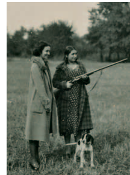
Ловният парк край Пловдив, прегосставен на Пловдивското ловно-стрелческо дружество „Сокол“, 1939 г.

Наличието на представителства и ремонтни работилници на актуалните автомобили и велосипеди, както и динамичното битие на улицата, я правят привлекателно място за обичащите риска и спорта. През годините на нея са се намирали ловното дружество „Сокол“ (ул. „Отец Паисий“ 15), сдружението на шофьорите, клубовете на мотоциклетистите и парашутистите. След 1949 година на „Отец Паисий“ е бил клубът на „Локомотив“ – Пловдив.