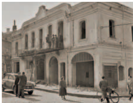
Разрушаването на хотел „България“ през 1960 г.

носи името „Хаджи Гьока Павлов“. До хотел „България“ е била сградата на Димитър Барос по проект на швейцарския архитект Емануел Лупос. В района е имало рибарски магазини, а в близост е била и прочутата Балък чаршия (Рибен пазар). Сега на мястото на съборените постройки се намира градинката при Джумая Джамия – неномерирано пространство между минало и настояще.