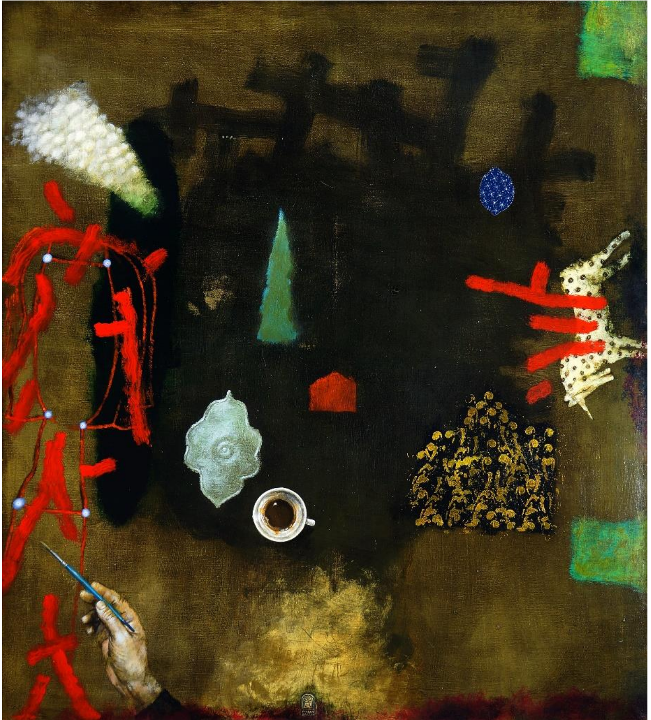
"Breakfast in the atelier", 2018, acrylic/canvas, 110/100 cm