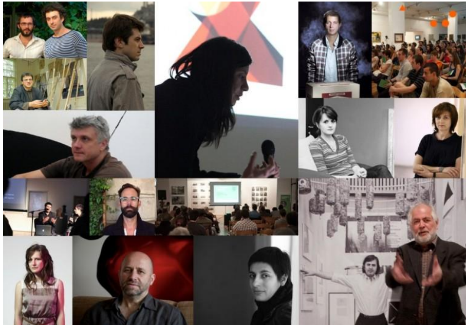
Някои от лекторите във „Въведение в съвременното изкуство“ досега

Смятахме, че да работим за образование в сферата на съвременното изкуство е и начин да опознаем по-добре средата, в която се намираме и която знаем, че може да се развие и да се превърне в полето на възможности, за което продължаваме да мечтаем.