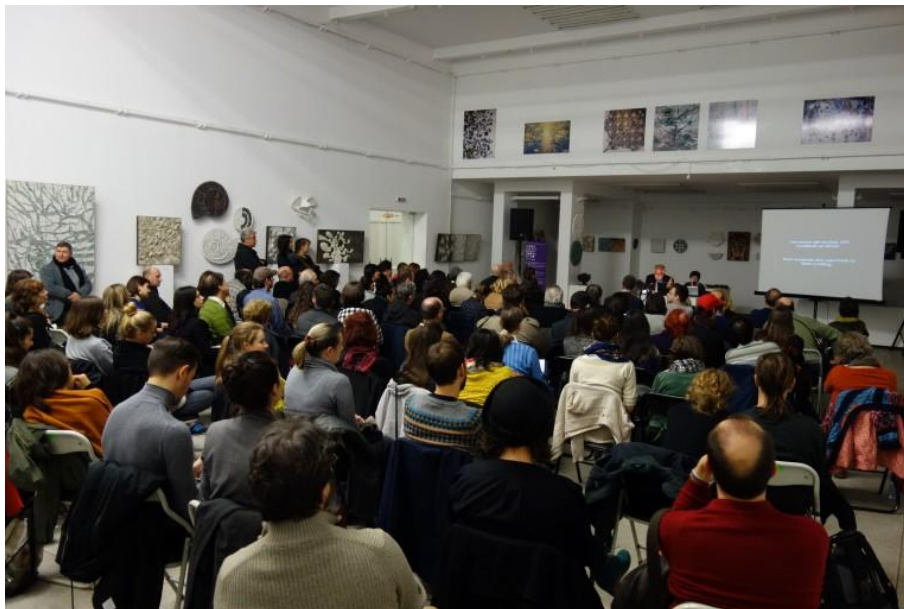
Въведение в съвременното изкуство 2015, Кураторите говорят, лекция на Рене Блок (Германия), галерия „Академия“