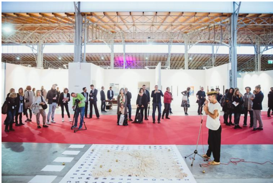
Фокус България на панаира Vienna Contemporary. Пърформанс на Войн де Войн. Alexander Murashkin / viennacontemporary