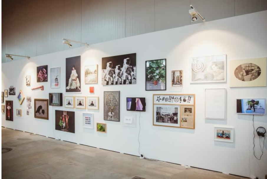
Фокус България на панаира Vienna Contemporary.

а в Пловдив – с клуб „Въведение в съвременното изкуство“. Споменах вече и едноименната рубрика в Лайт, която е също важна стъпка в посока присъствие на съвременното изкуство изобщо в медиите в България и достигането до по-голяма аудитория. Artnewscafe бюлетинът ни е също голяма слабост, правим го вече от толкова много години, преминали сме през трудности, но все пак успяваме и дори го разширяваме. Интересно е, че за всичките тези години той не се изчерпа и не стана по-малко значим, точно обратното. С изчезването на специализираните медии за изкуство става все по-трудно да се намери източник на информация за изложби и събития не в един или друг град, а в цялата страна плюс новини и за събития на Балканите и по света. Радваме се много и че се разрасна в платформа за критическа литература. Това е много важно и си пожелаваме успех в тази посока! 😊