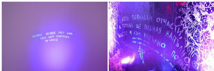
Теодор Ушев, „Като в тъмно огледало“, детайл от изложбата, 2018

реакцията на посетилите, че успяхме да вкараме хората в търсената траектория. Много се колебаех в началото да създам „път“, един вид инструктаж за разглеждане. Но сега виждам, че самото обиграване на пространството кара „преживяващият“ да „следва“ моята логика. Миксираната реалност не е самоцел – тя просто завършва спиралата на търсене.