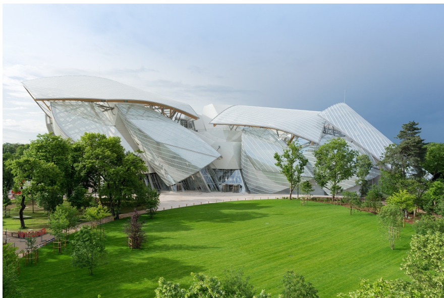
Галерия на фондация Луи Вюитон