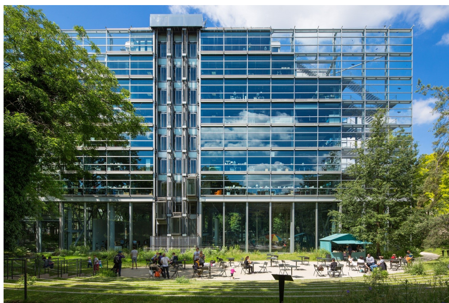
Сградата на Фондация Картие