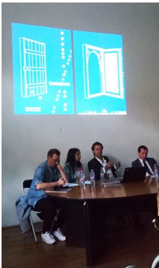
Представяне на проекта „Бронзовата къща“ в НХА, 2017