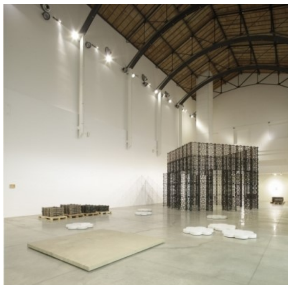
Пламен Деянофф, Бронзовата къща. Изложба в МАМбо – Museo d'Arte Moderna di Bologna, 2012.

Пламен Деянофф е роден през 1970 г. във Велико Търново. Завършва дърворезба в Художествената гимназия в Трявна. Продължава обучението си в Националната художествена академия в София, по-късно в Pratt Institute, Ню Йорк и Akademie der bildenden Künste, Виена.