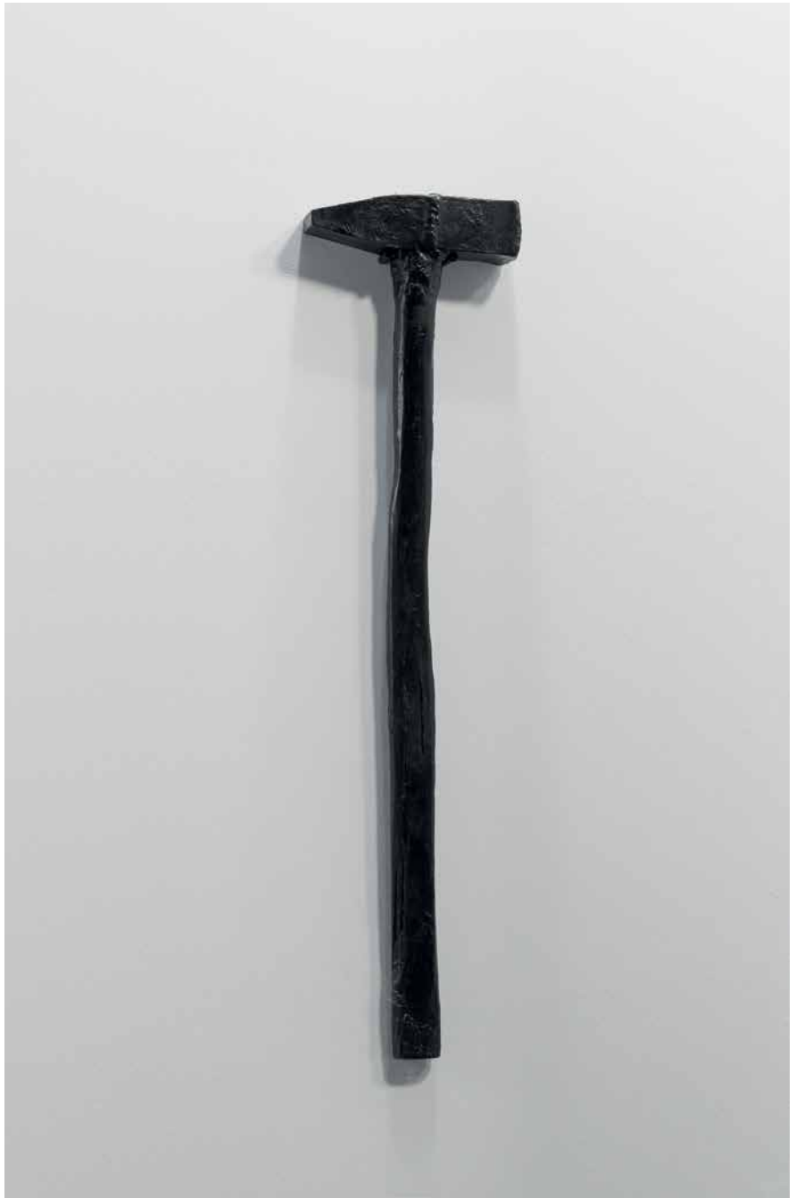
Untitled (Hammer), 2012 black glossy, polished bronze 84 x 23 x 7 cm Edition of 8 + 4 AP Edition Nbr. 2/8