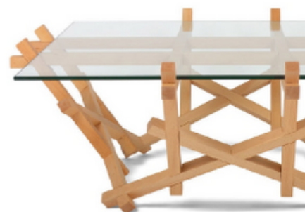
puzzle table PRAKTRIK 5x4

Те се различават от колегите си в чужбина само по отношение на мащаба, на финансирането и на средата, която подхранва и насърчава подобни млади таланти.